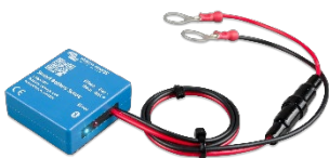
Bluetooth-Messung: Smart Battery Sense