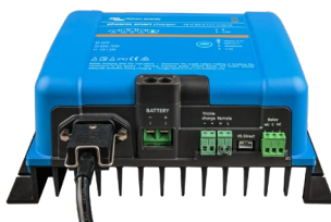
Phoenix Smart 12/50(1+1)