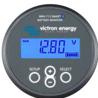
Bluetooth-Messung: BMV-712 Smart Batteriemonitor