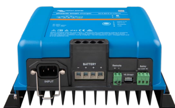
Phoenix Smart 12/50(3)